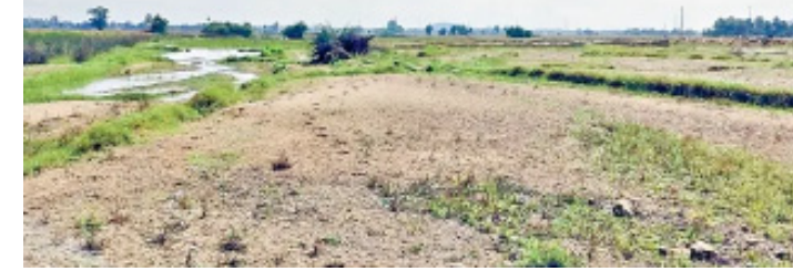
పనుల్లో ముందడుగు పడకుండా చేస్తున్నాయి.

ప్రతిపాదనలకే పరిమితం మరిపెడ మండలంలో తానంచర్ల పాలేరు వాగుపై లో తెవల్ వంతెనకొట్టుకుపోగా, తాత్కాలిక మరమ్మతులు చేశారు. శాశ్వత పనుల ప్రతిపాదనలపై పురోగతి లేదు. వర్షాకాలంలో లోతెవల్ వంతెన మీద నుంచి నీరు పారితే పది గిరిజన తలదాల వారు అయిదు కిమీ చుట్టూ తిరిగి వెళ్లాల్సి వస్తుందని చెబుతున్నారు.